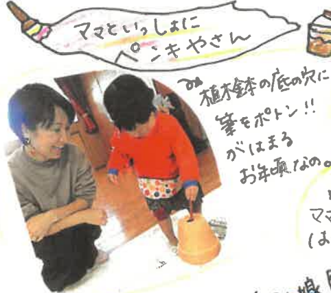
ママといっしょにニキヤさん 植木鉢の底の穴に筆をポン!! がはまるお年頃なの。 ママと一緒に(はじめのこぐまくらぶ) ドキドキ...

今回は、「みんな集まって〜」はやめて... 親子のタイミングであれなんでしょう？ やってみる？ と自然にあそびをはじめてみましょう♡