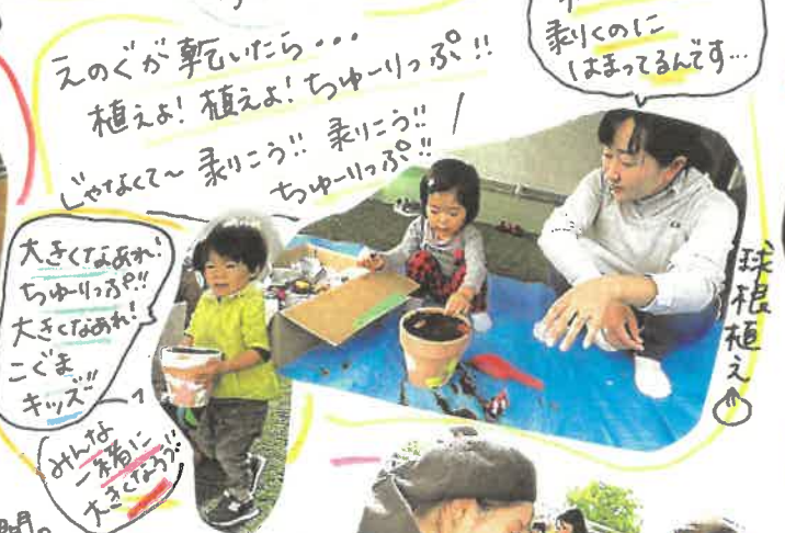
最近玉ねぎ剥くのにハマってる... えのぐが乾いたら... 植えよ! 植えよ! ちゅーっ!! しゃべって〜 剥こう!! 剥こう!! ちゅーっ!!