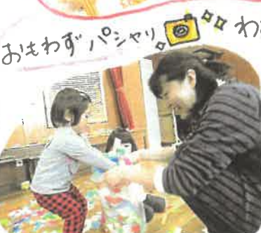
おまわりパシヤリ これはお母さんじゃないんです。自分のお母さんじゃないんです。子どもたちから他のお母さんにふれあってるんです。ありがた〜とどちらのお母さんもうれしうぞね。 ようちえんっていうところは、これがあるから。子どもたちもお母さんたちも育ち合える!! みんなでお母さんたちも育ち合えて。一緒に子育て。こぐまくらぶ♡