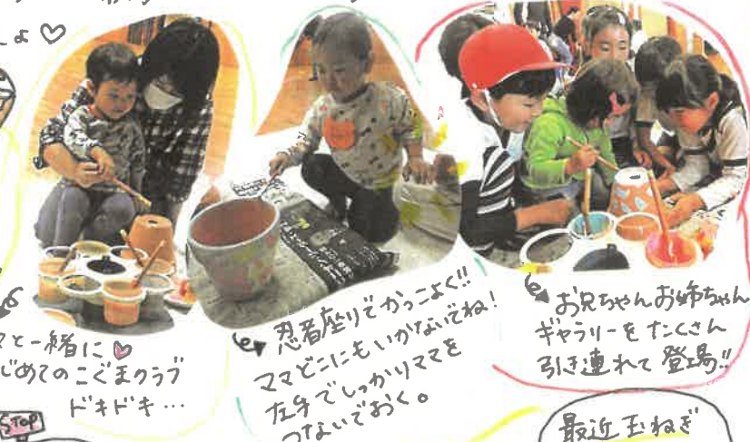
お兄ちゃんお姉ちゃんギャーをたくさん引き連れて登場!! 忍者座りぞからよく!! ママにもいきななね!! 左でしっかりママをつないでおく。