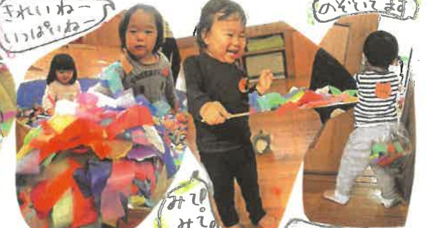
きれいわーいのはねー のどいす みじみじ しほりいす