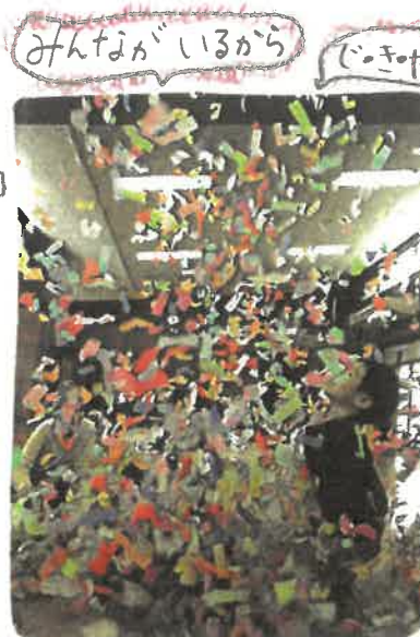
みんながいるから どこか

赤・黄・桃・緑・青・紫・橙・白...カラフルな色をみているだけでわくわくする。ひらひらとおちてくるお花がみ。ふわふわできもちいいお花がみ。そんなお花がみの動きをみているとゆったりとほんわが優しい気持ちになる。袋に入れてカラフルな色を詰めたりふわふわを箱に入れてからひっくりかえしてみたりふんわりおふとんにして寝てみたり。ほりなげる、ふきとばす、はじり回る。子どもたちの動きに合わせて何ともいえないうらやましいカラフルな素敵な空間が生まれていました。今回の芸術は「芸術はバクハツだ〜！」を掲げた11月のこぐまくらぶもカラフル色でいっしょに楽しみましたね。