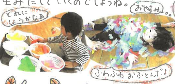
どれにしようかなあ ふわふわおふとんだよ

ちゃんとできるかどうかわかりません。みんなで見えを合わせてお花がみを仰ぐタイミングをそろえて仰いでいくと... お花がみの山がもち上がり柱のように高く舞い上がりました。「芸術はバクハツだあ〜!!」この光景に感動!! これは私ひとりでは決してできなかったこと。あるいはお友達とお母さんの2人だけでもできなかったこと。そこにお友達がいるから。そこにお母さんたちがいるから。そこに先生がいるから... みんなでできる楽しい活動がみんなといううれしい気持ち色々なことを考えるか感じるかを生みだして行くのでしょね。