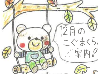
12月のこぐまくらぶご案内!

12月28日(月)・30日(火) 両日とも参加OK 『どん どん うど〜ん』 2日間かけてうどん作りには挑戦します。旧だけでも2日間でも都合に合わせて来て下さい。 エプロン・三角布・お箸を持って来て下さい。子ども用のスプーン・フォーク・エプロンもあれば持って来て下さい。 12月17日(火) 『サンタクロースはど・こ・だ』 ちゅっぴりはやいこぐまのクリスマスをします。サンタクロースに会えるかな? 参加される前日までに連絡をお願ひし 12月も楽しいこといろいろあります。みんな遊びに来てね!