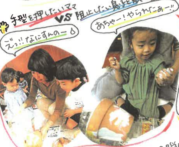
手型を押したいママ VS 阻止したい息子と娘 えっ!! なにすんのー!! あちゃー! やられにゃー!!